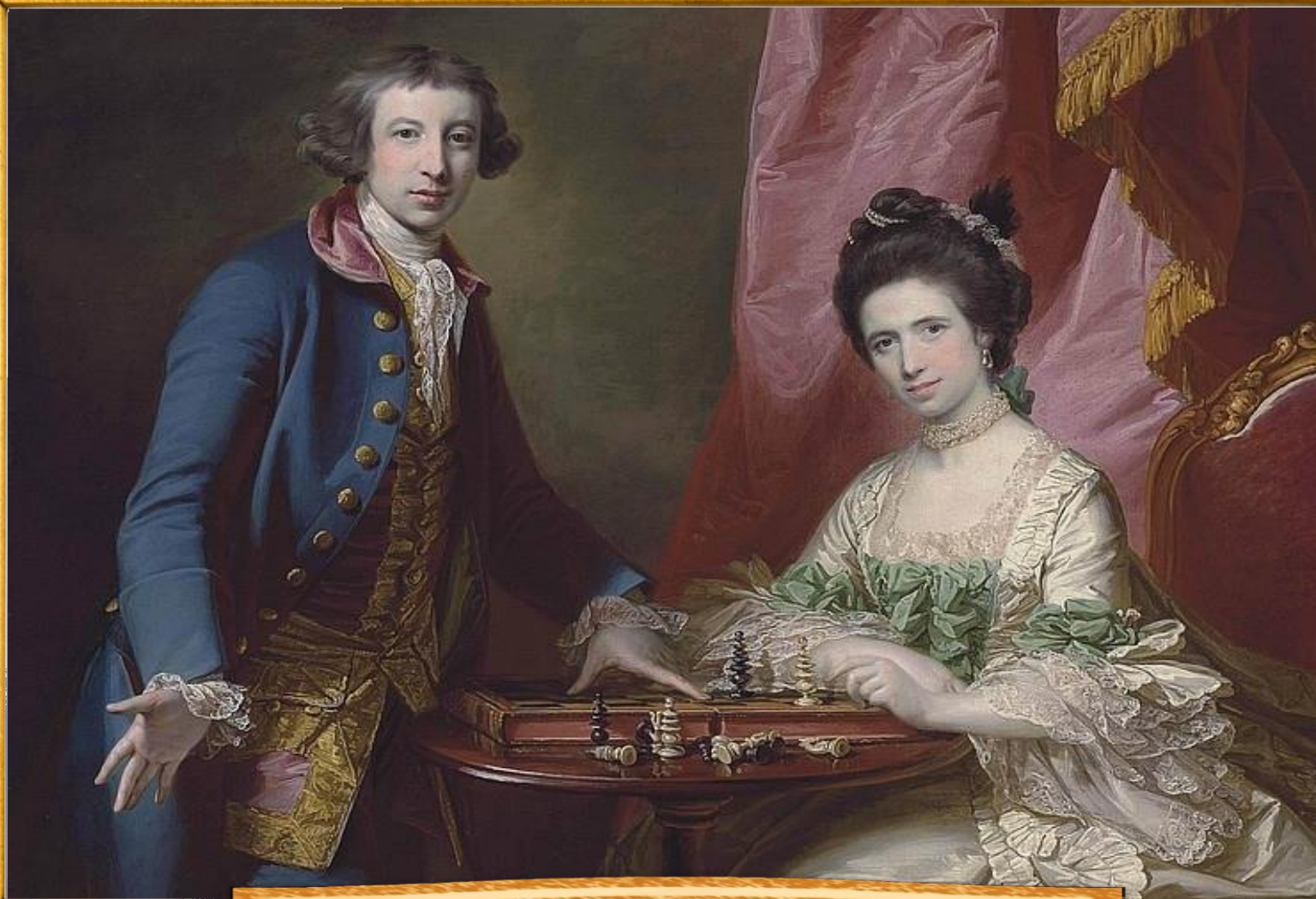
Фрэнсис Котс 1789 «Играющие в шахматы»