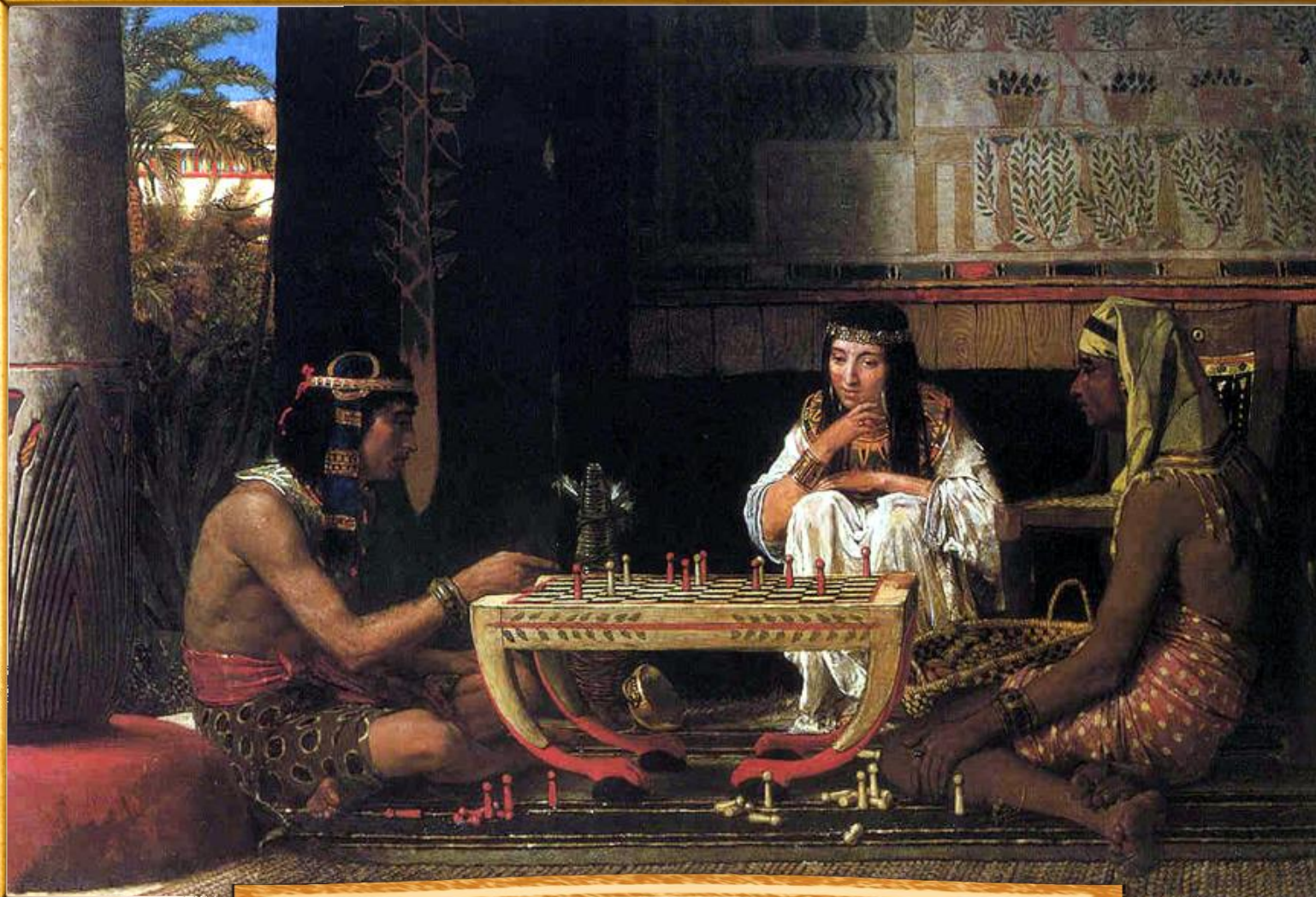
Альма-Тадема Лоуренс 1865 «Египетские шахматисты»