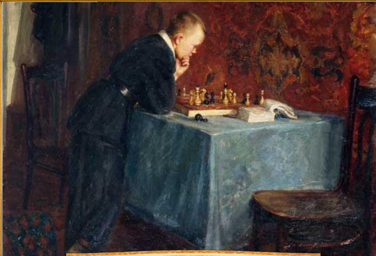
Решетников Фёдор 1938 «Шахматная задача»