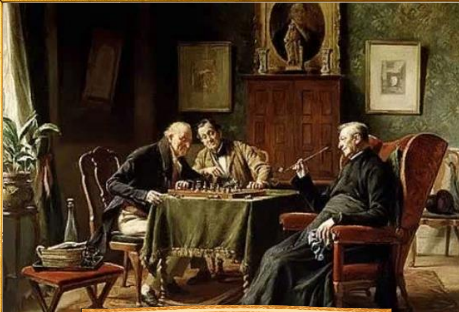
Гарард Йозеф Портилье конец XIX в. «Игра в шахматы»