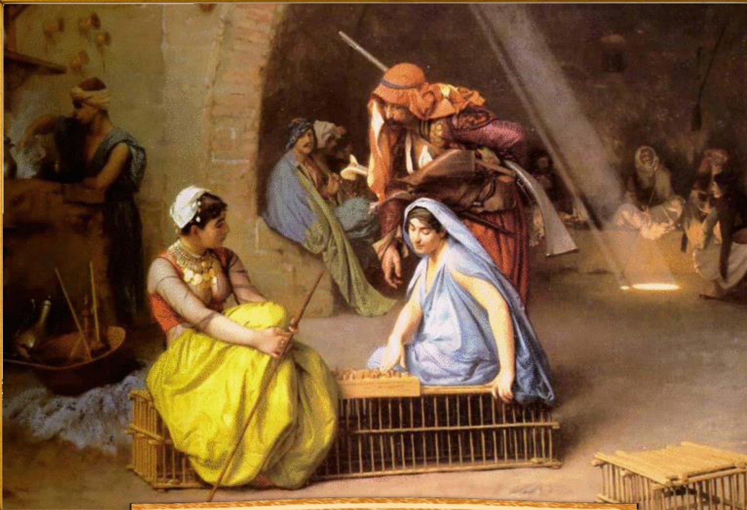
Жан-Леон Жером 1870 «Альмеи, играющие в шахматы»