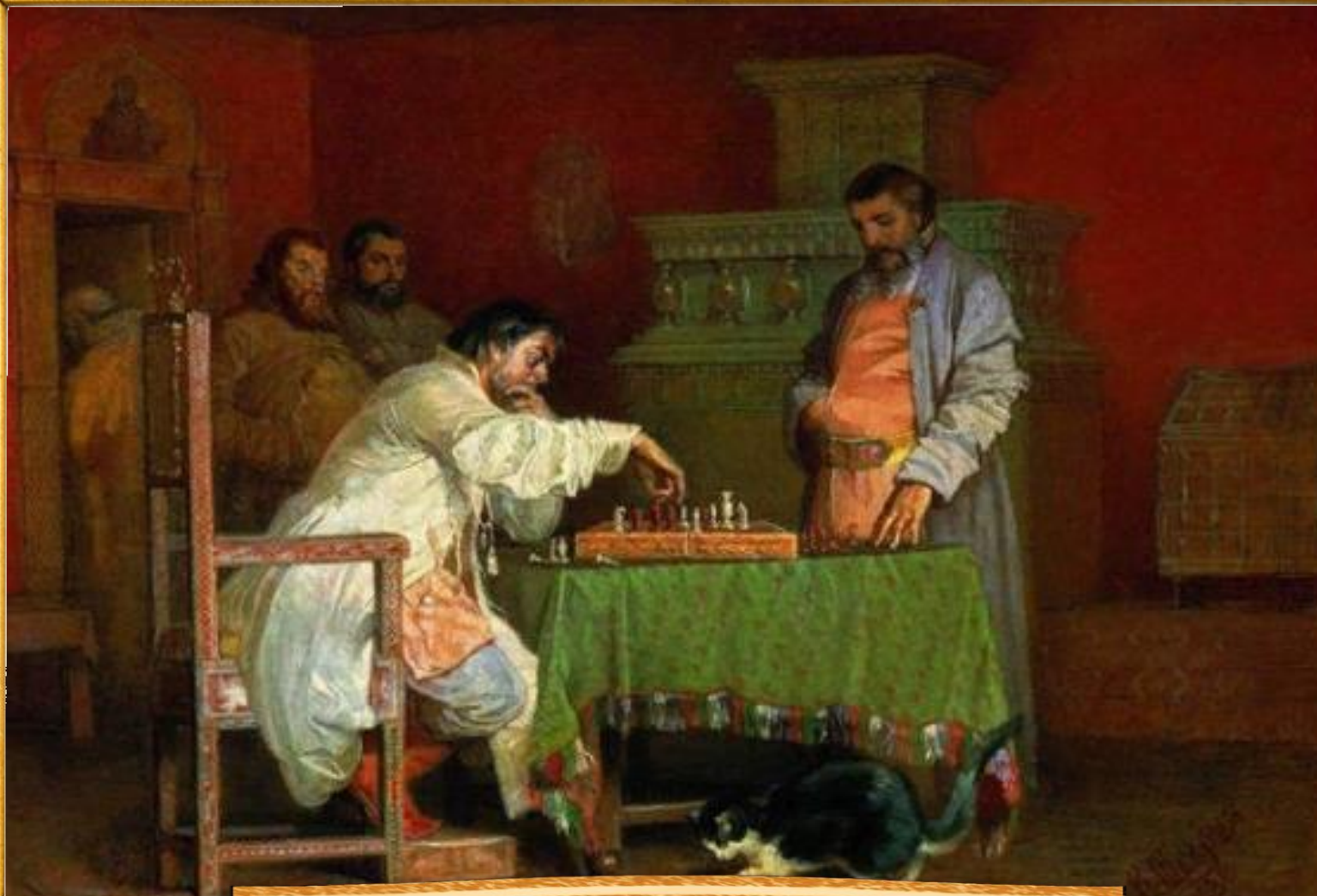
Шварц Вячеслав 1865 «Сцена из домашней жизни русских царей»