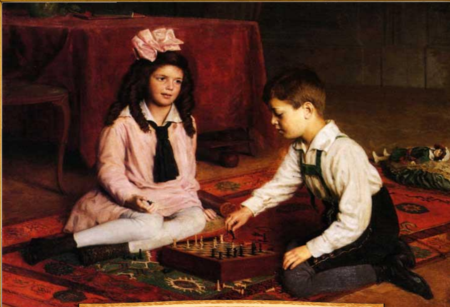
Пробст Карл 1902 «Шахматный матч»