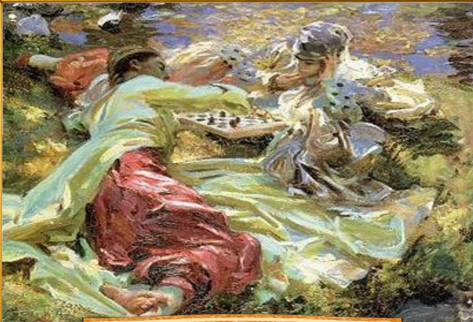
Джон Сингер Сарджент 1907 «Игроки в шахматы»