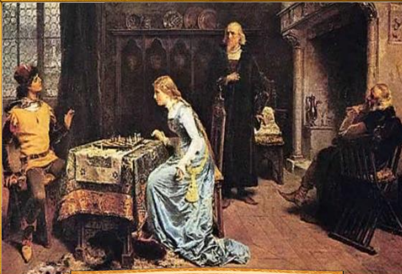
Джиролама Индино 1881 «Шахматисты»