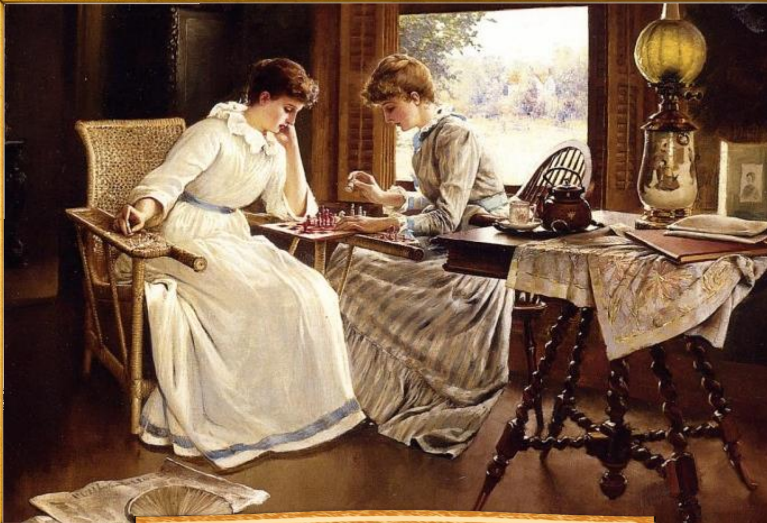
Фредерик Джаду Ваугх 1929 «Шахматисты»