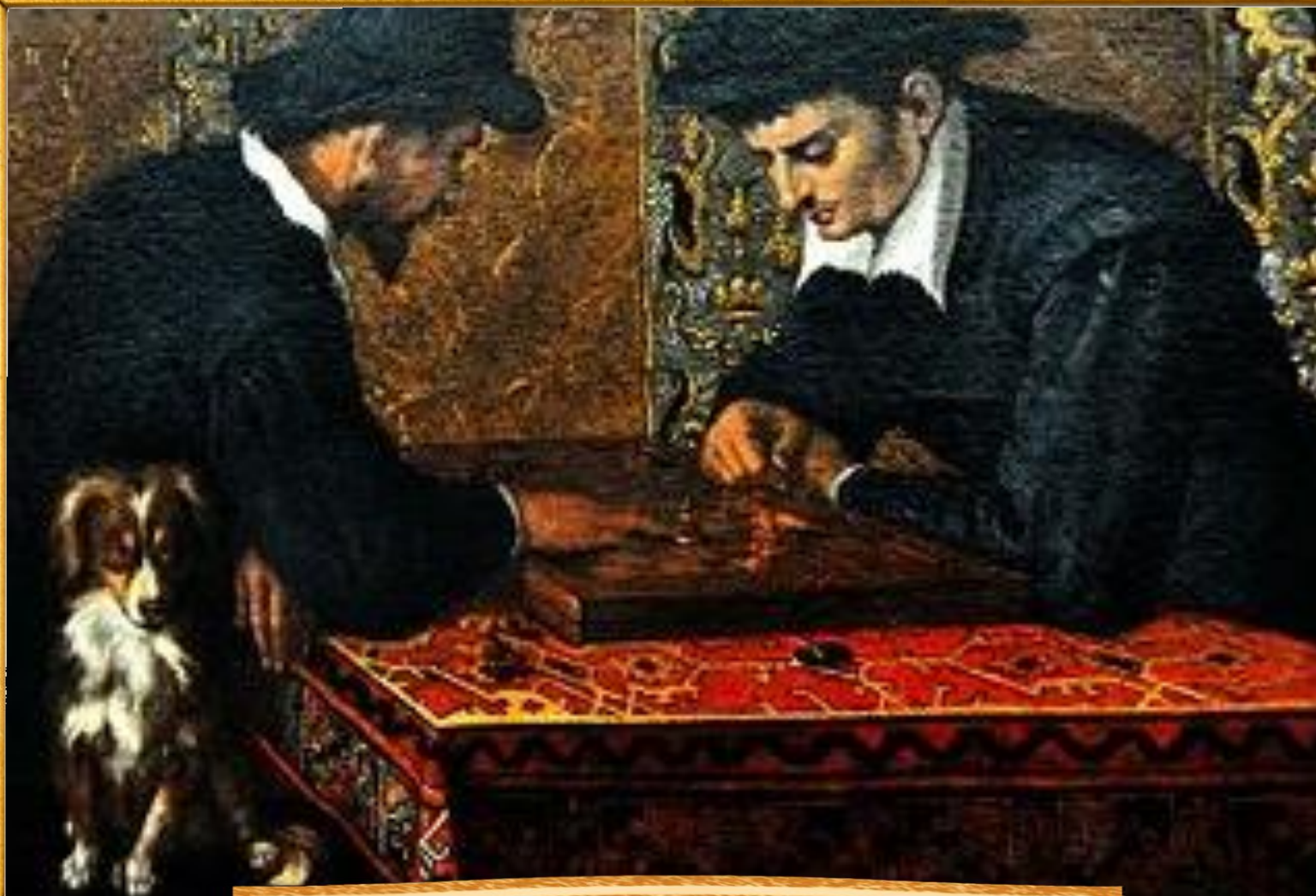
Лодовико Карраччи 1590 «Игроки в шахматы»