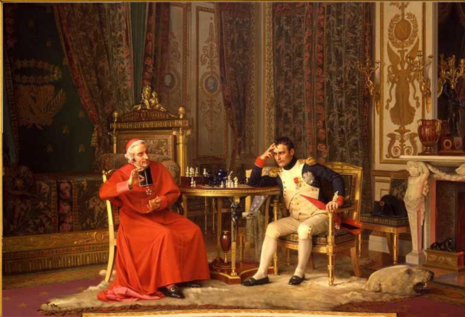
Жан-Жорж Вибер «Шах!»