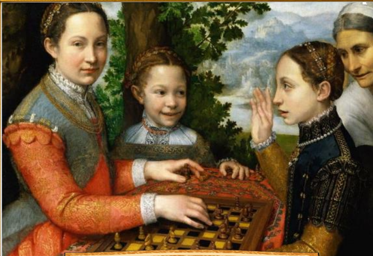
Ангиссола Софонисба 1555 «Сестры играющие в шахматы»