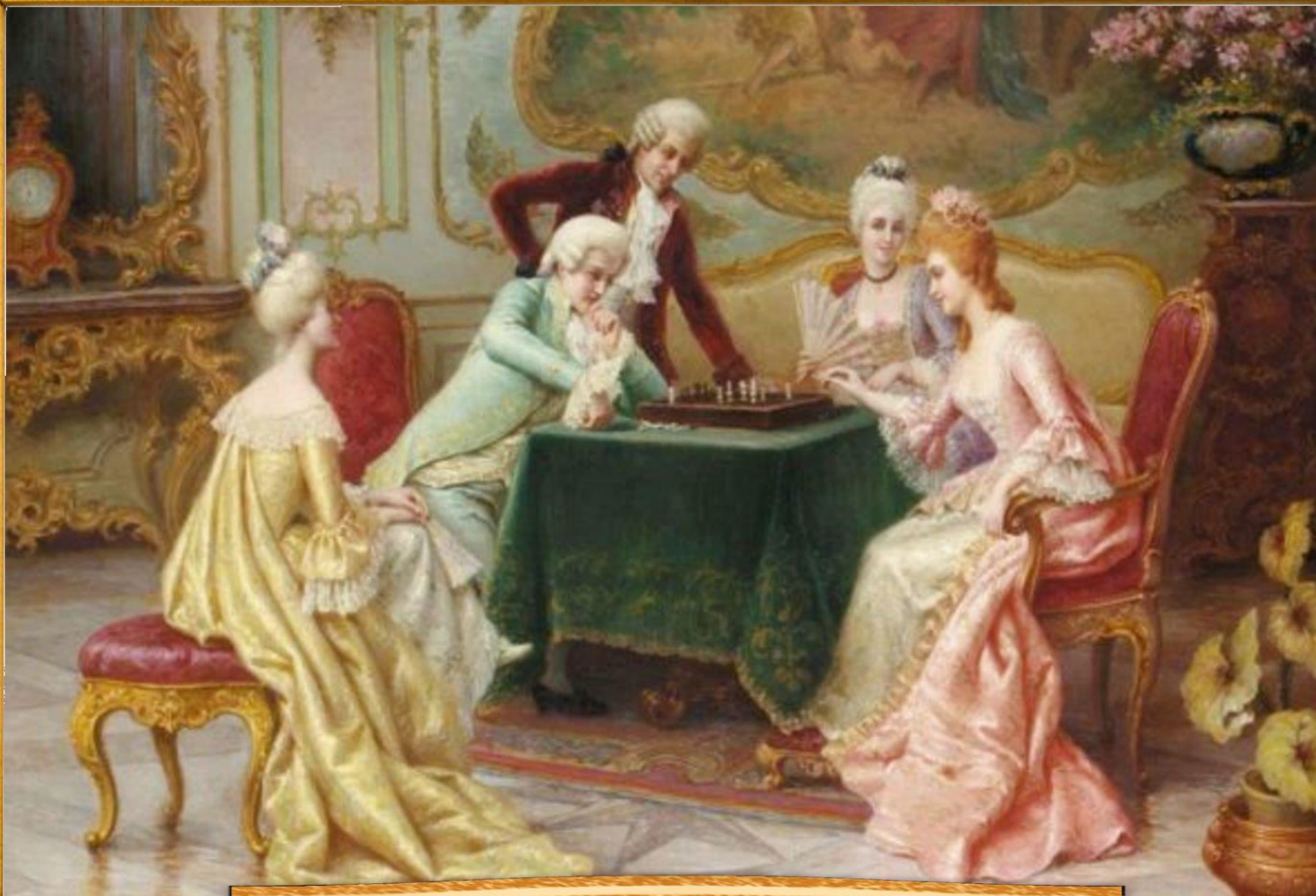
Арту́ро Риччи́ конец XIX в. «Игра в шахматы»