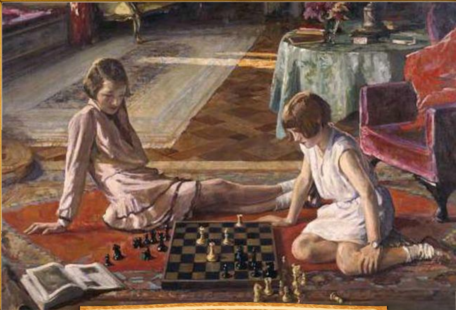
Джон Лавери 1929 «Шахматная игра»