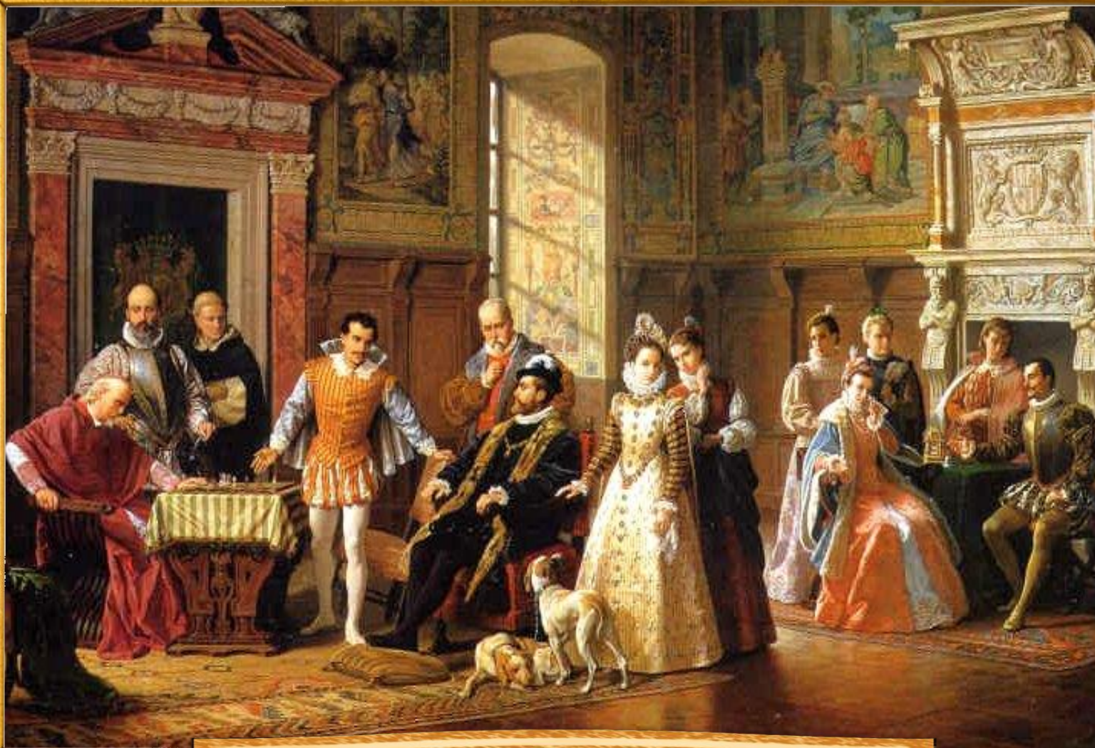
Луиджи Муссини 1883 «Шахматный турнир испанского короля»