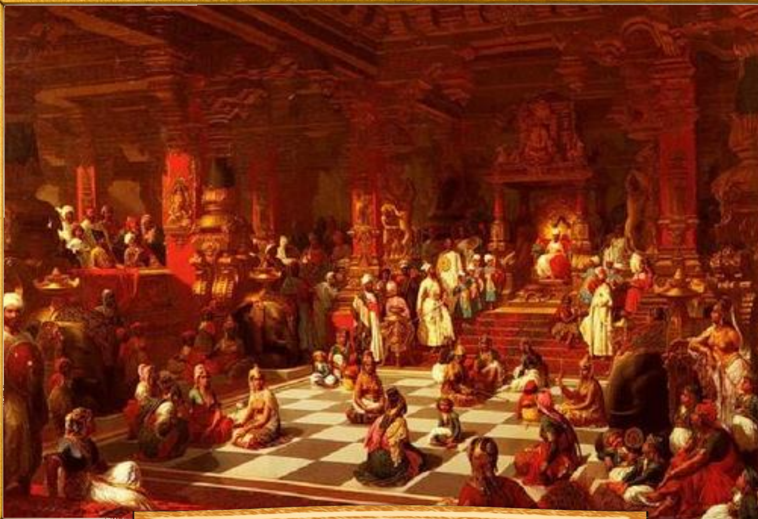
Анри Пьер Пику 1876 «Индийская игра - живые шахматы»