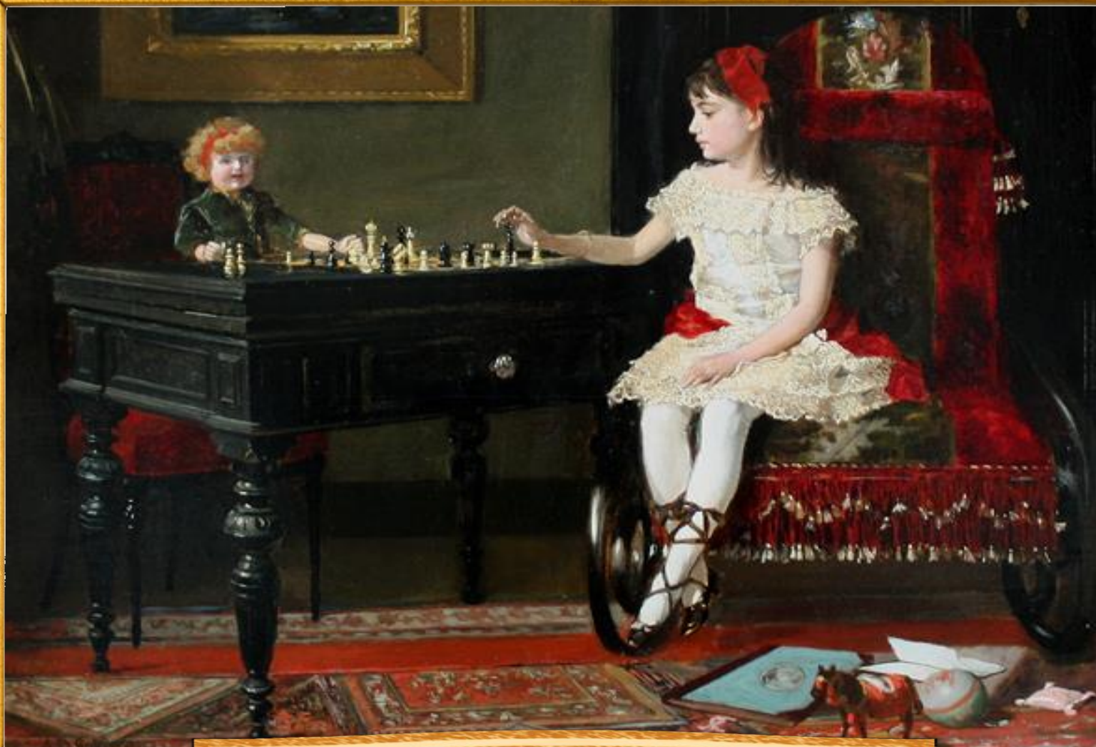
Александр Деметриус Гольц 1900 «Девочка с куклой»