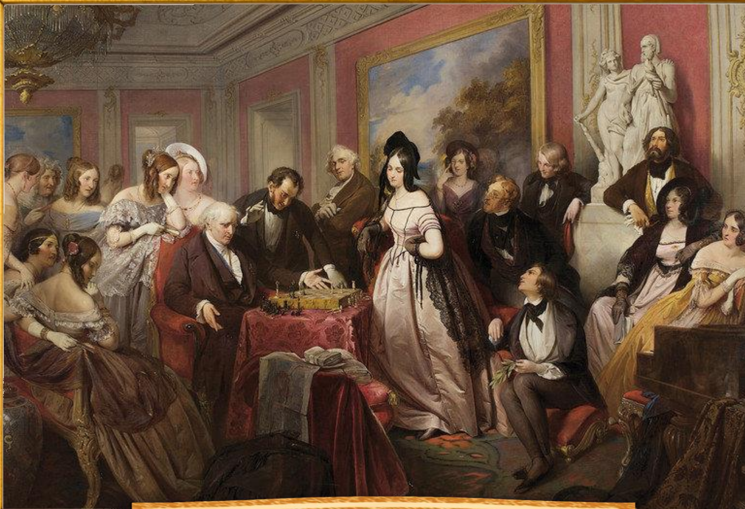
Данхаузер Иосиф Франц 1839 «Игра в шахматы»